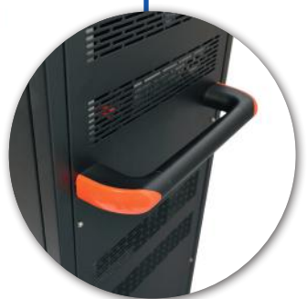
Ergonomic side handles Poignées latérales ergonomiques

FOR TABLETS, NOTEBOOKS & ELECTRONICS DEVICES UP TO 14"