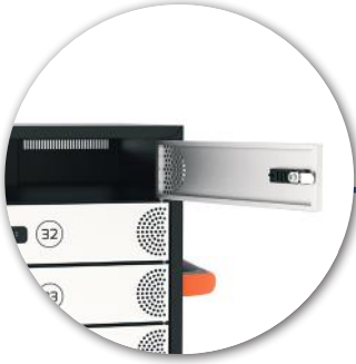
Individual lockable doors Portes individuelles verrouillables