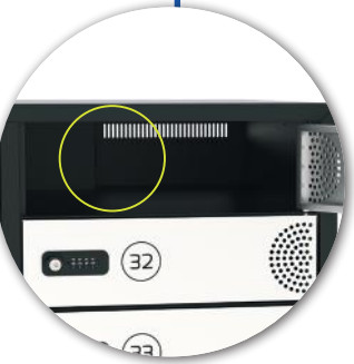
1 AC power sockets per door 1 prise de courant électrique par casier