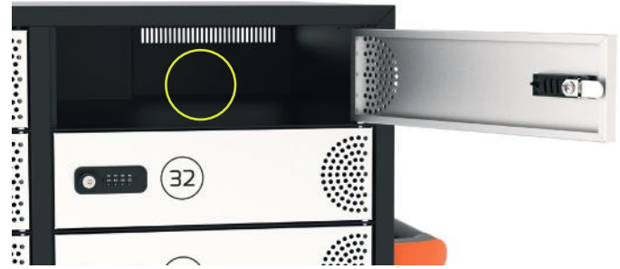
40 AC socket to supply up to 14" devices 40 prises secteur pour alimenter les appareils jusqu'à 14"