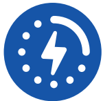
Charge 5 volt USB port