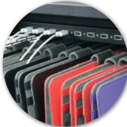
Charge progress LED indicator Indicateur LED de progression de charge