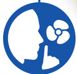
Silent cooling stand

Dispositif de refroidissement silencieux