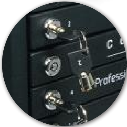
Individual lockable doors Portes individuelles verrouillables