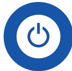
Charge indicator LEDs