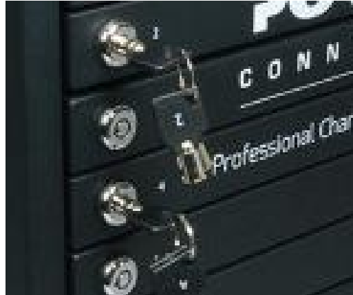
Individual lockable doors Portes individuelles verrouillables