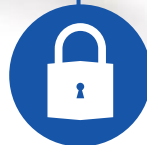
Individual lockable doors

Dispositif de refroidissement silencieux