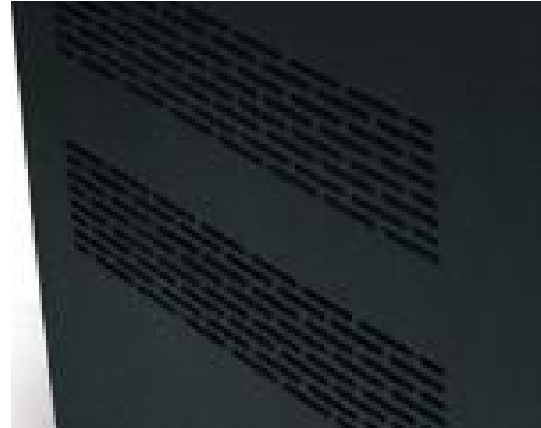
Silent cooling stand Stand de ventilation silencieux