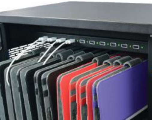
Charge progress LED indicator Indicateur LED de progression de charge