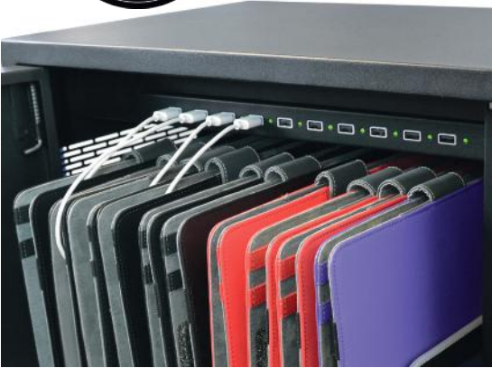
Charge progress LED indicator Indicateur LED de progression de charge