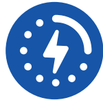
Charge 5 volt USB port