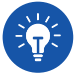
UV lamp Lampe UV