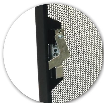
3 points lock Fermeture 3 points