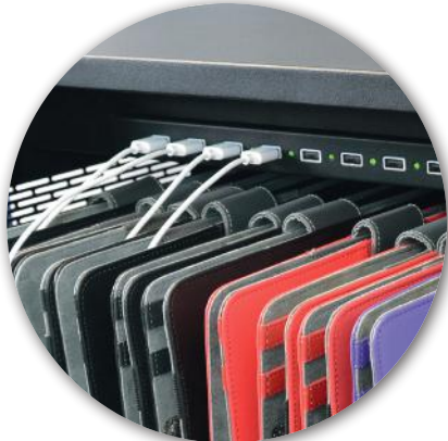
Charge progress LED indicator Indicateur LED de progression de charge