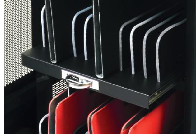
Sliding shelves Tiroirs coulissants