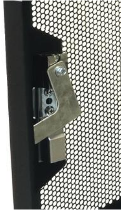
3 points lock Fermeture 3 points