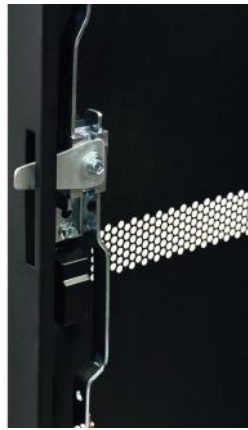
3 points lock Fermeture 3 points