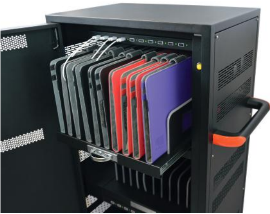
Sliding shelves Étagères coulissantes