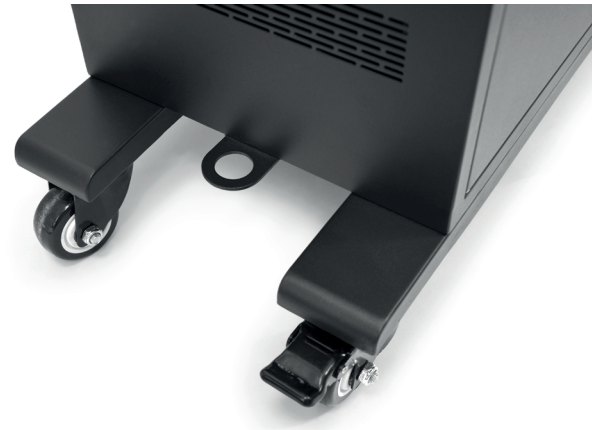
Omnidirectional wheels with brakes + hook for security cable Roues multidirectionnelles avec freins + point d'ancrage pour câble de sécurité