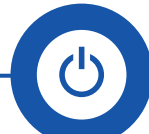
Charge indicator LEDs LED Indicateur de charge