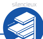
Sliding shelves Tiroirs coulissants