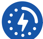
Charge 5 volt USB port