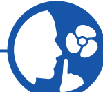
Silent cooling stand Dispositif de refroidissement silencieux