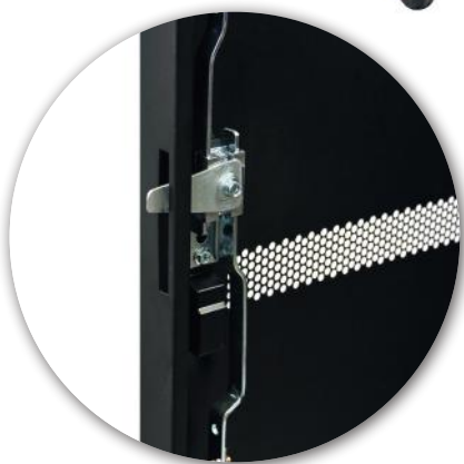
3 points lock Fermeture 3 points