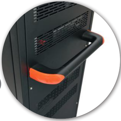
Ergonomic side handles Poignées latérales ergonomiques