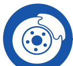
Omni directional wheels + brakes Roues multidirectionnelles + freins