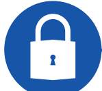
Secure 3 point lock Fermeture en 3 points