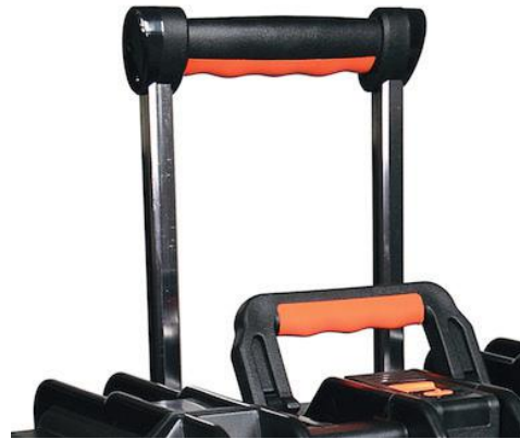
Extensible trolley Trolley extensible