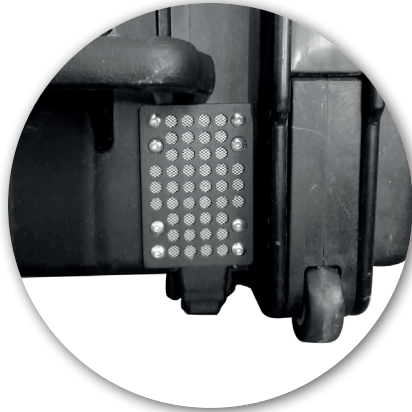
Ventilation grid Grille de ventilation