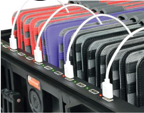
Charge progress LED indicator Indicateur LED de progression de charge