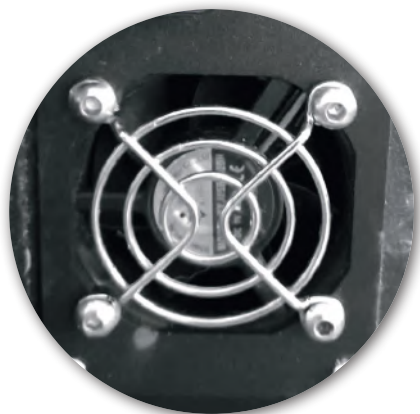
Integrated cooling fan Ventilateur de refroidissement intégré