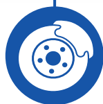
Omni directional wheels + brakes Roues multidirectionnelles + freins