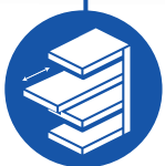
sliding shelves Tiroirs coulissants