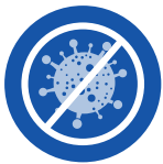
UV lamp Lampe UV