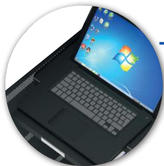
1 sliding rack for notebook 1 tiroir coulissant pour PC portable