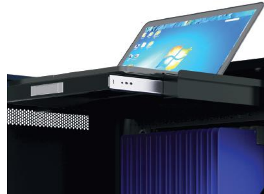
Sliding rack for notebook up to 17" Tiroir coulissant pour PC portable jusqu'à 17"