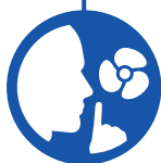
Silent cooling stand Dispositif de refroidissement silencieux