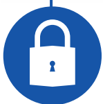
Secure 3 point lock Fermeture en 3 points