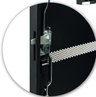
3 points lock Fermeture 3 points