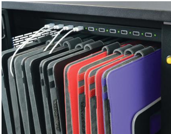
Charge progress LED indicator Indicateur LED de progression de charge