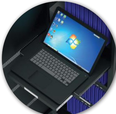
1 sliding rack for notebook 1 tiroir coulissant pour PC