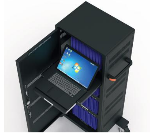
1 sliding rack for notebook up to 17" 1 tiroir coulissant pour PC jusqu'à 17"