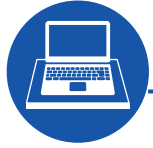
Sliding rack for notebook Tiroirs coulissants pour PC