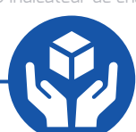
Ergonomic side handle Poignée ergonomique