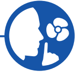
Silent cooling stand Dispositif de refroidissement silencieux