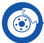
Omni directional wheels + brakes Roues multidirectionnelles + freins